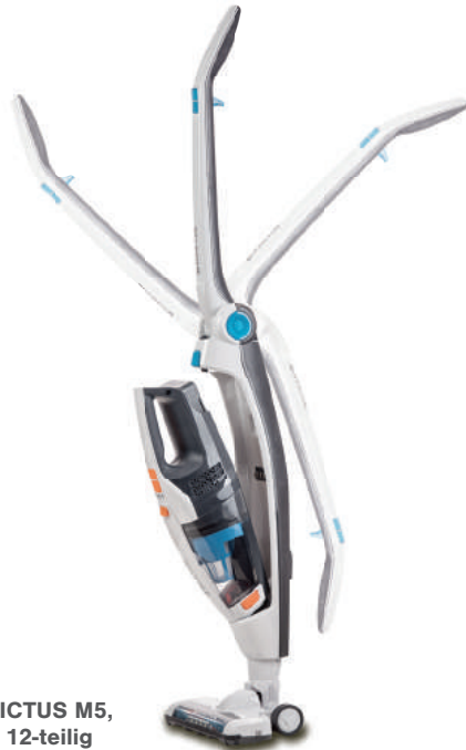
INVICTUS M5, Set 12-teilig