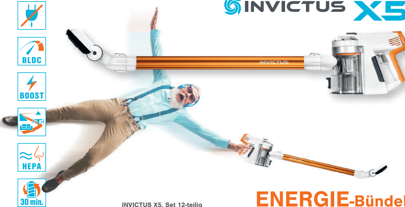
INVICTUS X5, Set 12-teilig